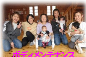
ボディメンテナンス