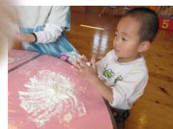
感触あそび(小麦粉)