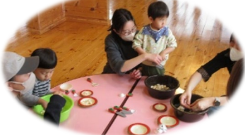
感触あそび おふの感触はどうだったかな?