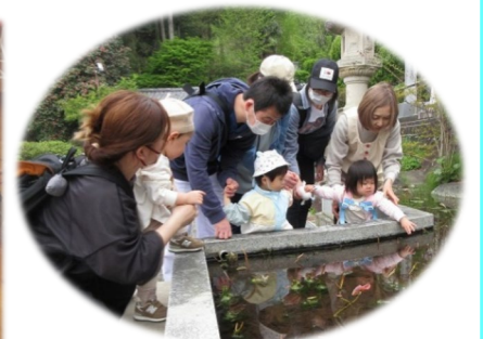
おたまじゃくし みつけた!