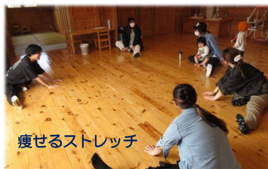
痩せるストレッチ