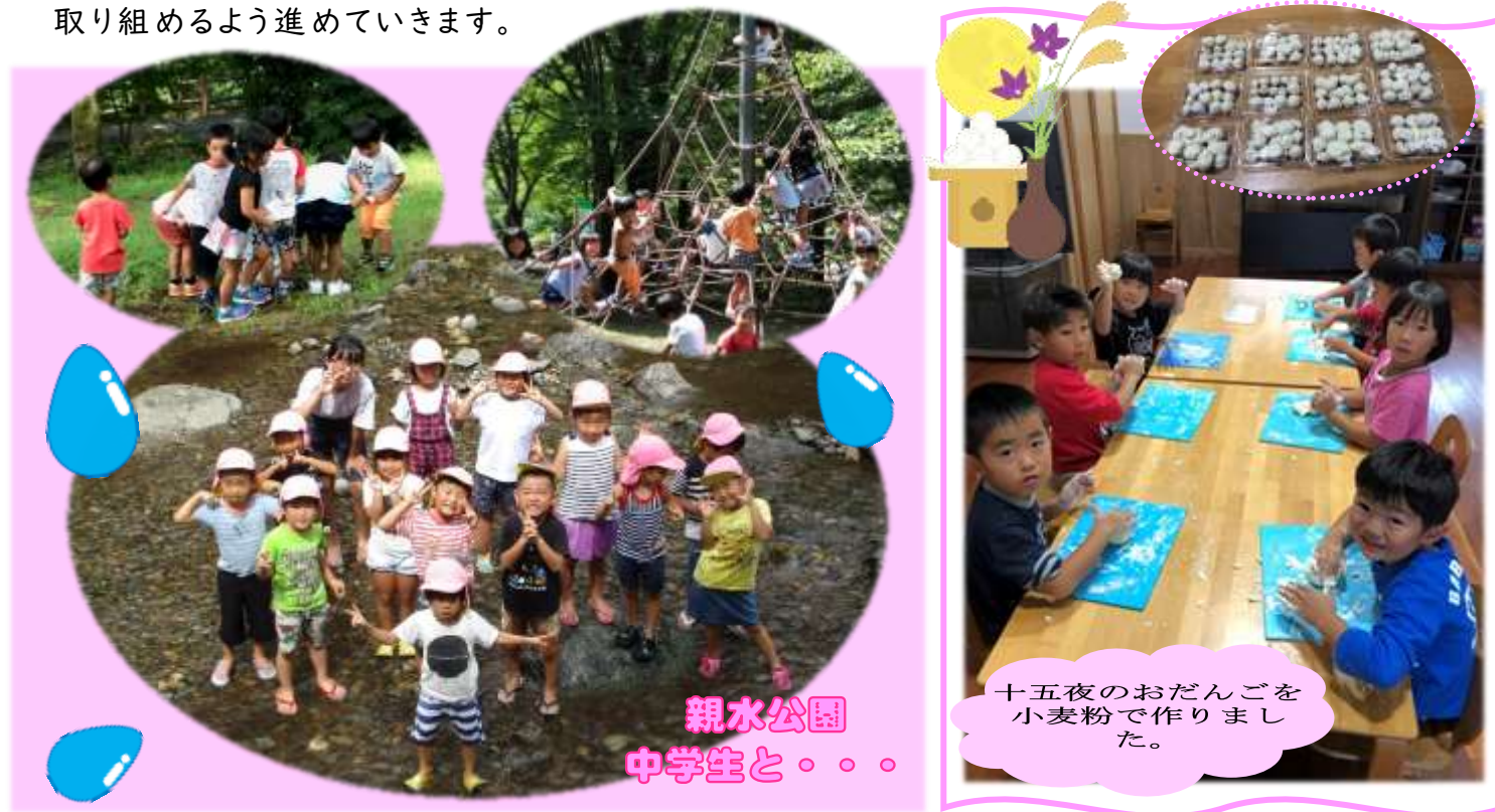
親水公園 中学生と・・・